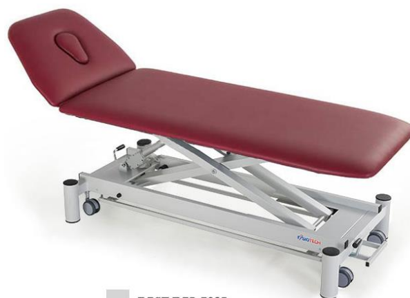
BASE RAL 7035