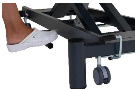
Giove 2 hydraulique