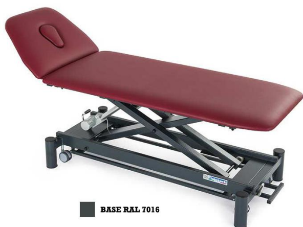
BASE RAL 7016