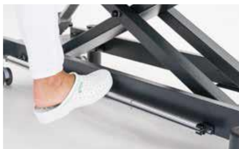
Giove 2 avec cadre de commande périphérique en aluminium