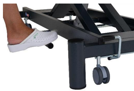
Giove 2 idraulico