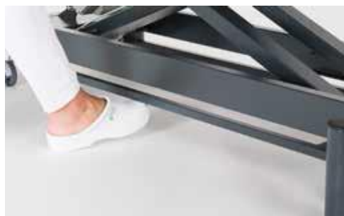
Giove 2 con pedaliera circolare