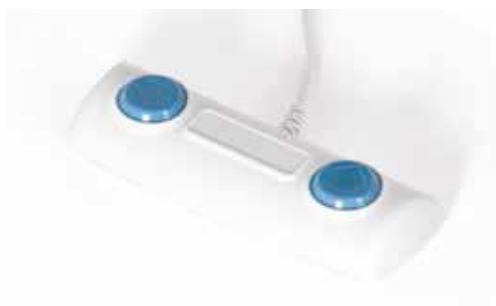
Giove 2 con comando a pedale 24 V